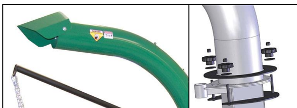
Chimenea de expulsión reforzada y orientable 360° de serie

Aspira y tritura más residuos que cualquier otra aspiradora de furgón, diseñada para ser utilizada con suma facilidad a la vez que con más poder de aspiración y triturado que otros modelos de su competencia (fabricada en grueso acero de primera calidad, lo que además garantiza la larga vida de esta máquina)