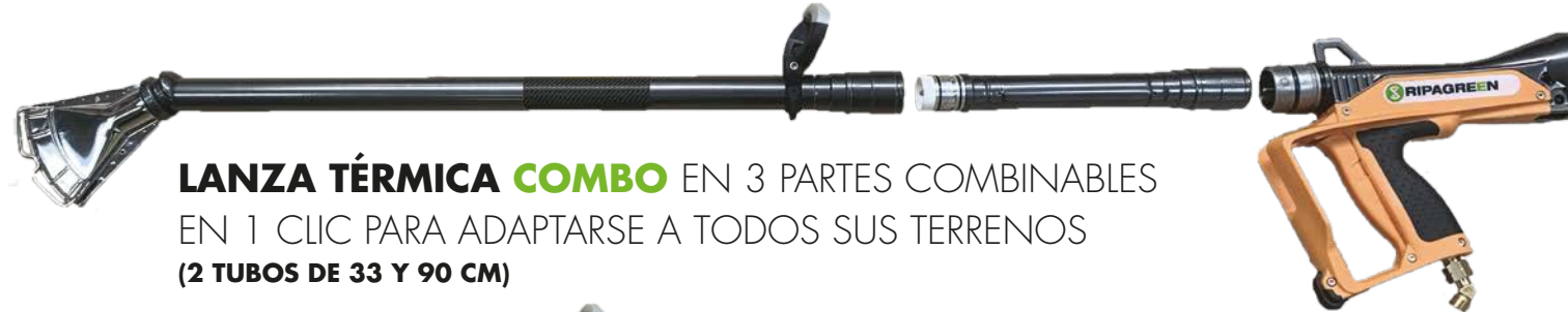
LANZA TÉRMICA COMBO EN 3 PARTES COMBINABLES EN 1 CLIC PARA ADAPTARSE A TODOS SUS TERRENOS (2 TUBOS DE 33 Y 90 CM)